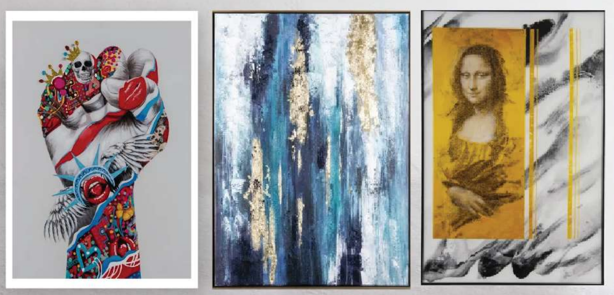
Code : 120776