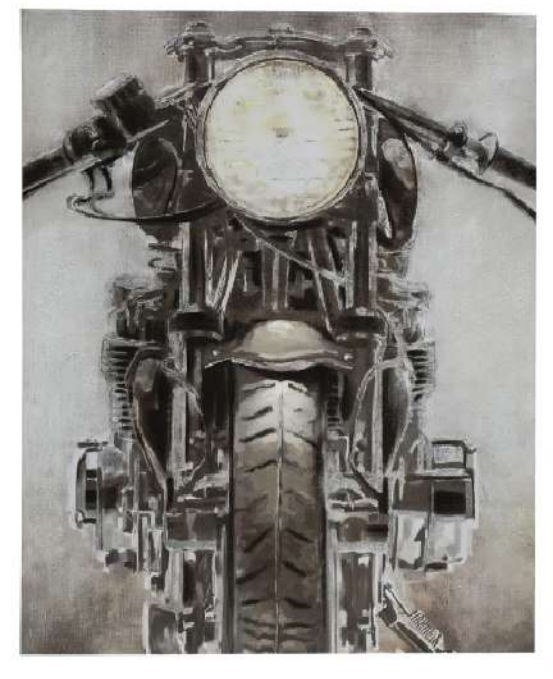
Code : 128818

Too often in interior design, we see wall art treated as an afterthought. It's what gets dealt with last, long after the final coat of paint has dried on the walls and all of the furniture has been artfully arranged, if it gets dealt with at all. But, we're here to argue that by relegating wall art to the side lines, you're missing out on an amazing design opportunity. We think that wall art matters most in interior design.